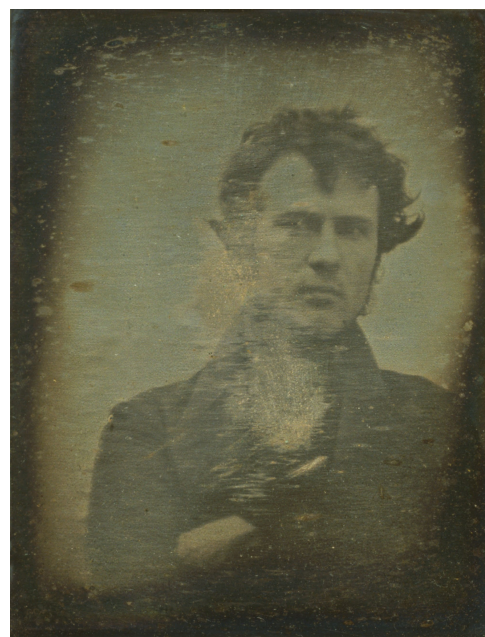
A primeira selfie do mundo: Robert Cornelius, 1839

Para vocês terem uma ideia, historiadores da fotografia acreditam que a primeira selfie foi tirada ainda em 1839 pelo fotógrafo americano Robert Cornelius. Com a tecnologia da época, Cornelius teve que ficar imóvel por um período de 3 a 15 minutos para ser registrado por ele mesmo. Imaginem ter que ficar parado esse tempo todo para tirar uma única foto.